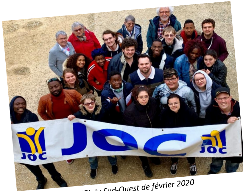
SFJ du Sud-Ouest de février 2020

Si tu ne viens pas, il manquera quelqu'un !