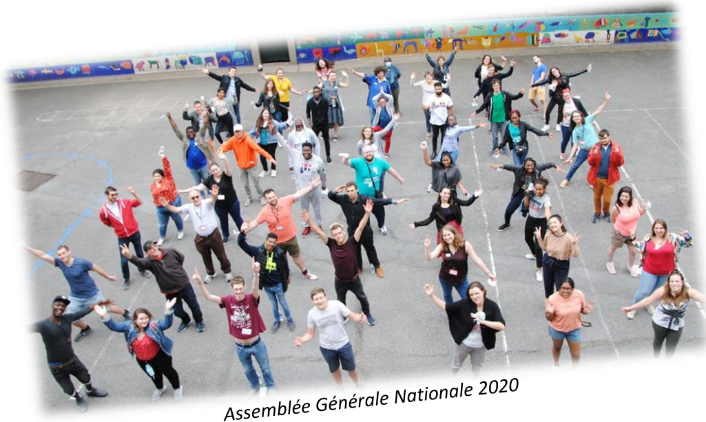
Assemblée Générale Nationale 2020

Si tu ne viens pas, il manquera quelqu'un !