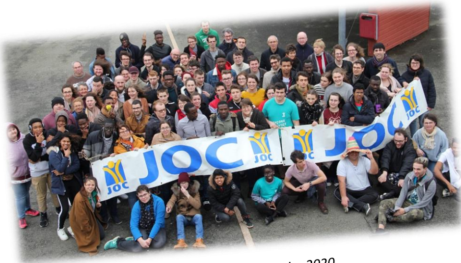
SFJ de l'Ouest de février 2020